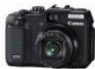
รูปที่ 3.1 กล้องดิจิทัล