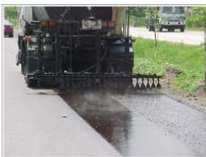
รูปที่ 2.8 การฉีดพ่นแอสฟัลต์