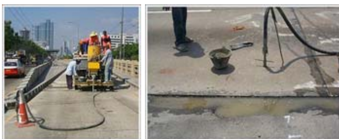
รูปที่ 2.5 การอัดน้ำปูน (Sub Sealing)