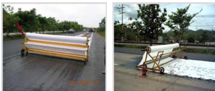
รูปที่ 2.9 การปูแผ่นใยสังเคราะห์