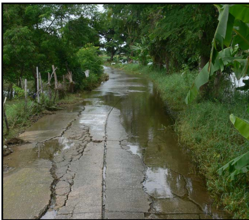
รูปที่ 4.1 ความเสียหายของถนน ค.ส.ล. บ้านยู้ง หมู่ที่ 1

ถนนที่เกิดความเสียหายตั้งอยู่ด้านทิศตะวันตกของตำบลบ้านโพธิ์ สภาพเดิมเป็นถนนกว้าง 5 เมตร และยาว 300 เมตร พื้นที่ความเสียหายประมาณ 600 ตารางเมตร ความเสียหายมีความรุนแรงเฉพาะจุดและปานกลางตลอดแนวถนน ลักษณะความเสียหายรุนแรงที่พบเป็นการทรุดตัวต่างระดับ (Faulting) ซึ่งสังเกตได้จากแผ่นพื้นติดกันมีระดับที่แตกต่าง ความเสียหายเกิดจากการทรุดตัวของชั้นฐานรากไม่เท่ากันหรือความคลาดเคลื่อนจากการใช้เหล็กเสริมถ้ายน้ำหนัก (รูปที่ 4.1) ดังนั้น แนวทางการแก้ไขที่เหมาะสมที่สุดคือแนวทางที่ 3 รายละเอียดค่าก่อสร้างแสดงดังตารางที่ ก.ราคาค่าก่อสร้างมีมูลค่าประมาณ 734,200.00 บาท