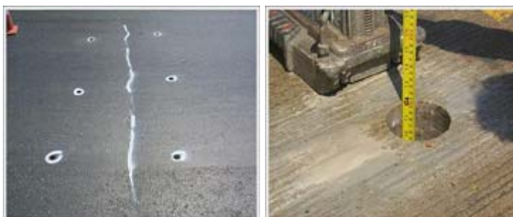
รูปที่ 2.4 การเจาะรูขนาดเส้นผ่านศูนย์กลางประมาณ 30-60 มม. 1.25 - 2.50 นิ้ว