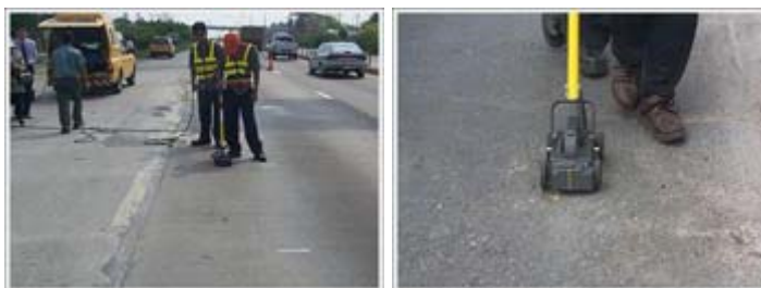
รูปที่ 2.3 การตรวจสอบโพรงใต้พื้นถนนคอนกรีต