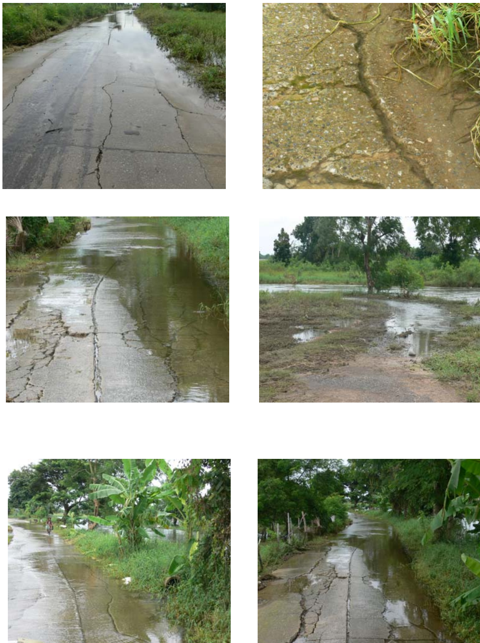
รูปที่ 2.11 ภาพความเสียหายของถนนคอนกรีตเสริมเหล็กที่ชำรุดเนื่องจากอุทกภัย ตำบลบ้านโพธิ์ อำเภอเมือง จังหวัดนครราชสีมา