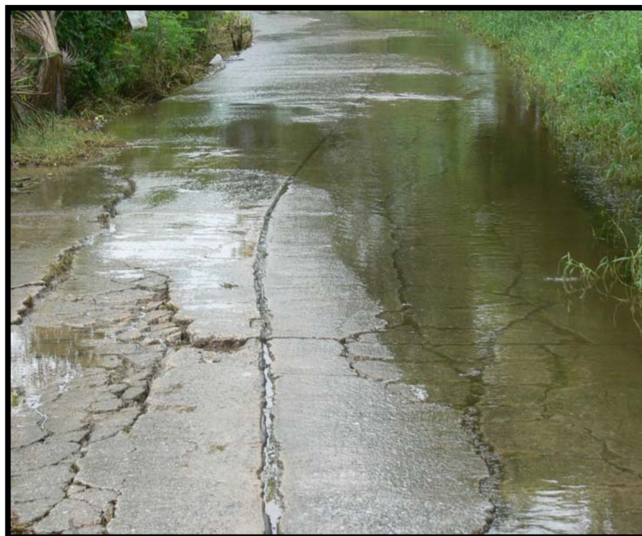
รูปที่ 4.2 ความเสียหายของถนน ค.ส.ล. บ้านมะค่า หมู่ที่ 6

ถนนเดิมมีความกว้าง 5 เมตร และยาว 500 เมตร พื้นที่ความเสียหายประมาณ 500 ตารางเมตร เสียหายเกิดรุนแรงและเฉพาจุด ถนนนี้ตั้งอยู่ด้านทิศใต้ของตำบลบ้านโพธิ์ ลักษณะความเสียหายเป็นการทรุดตัวต่างระดับ (Faulting) สังเกตได้จากแผ่นพื้นติดกันมีระดับที่แตกต่างกัน ความเสียหายน่าจะเกิดจากการทรุดตัวของชั้นฐานรากที่ไม่เท่ากัน หรือความคลาดเคลื่อนจากการใช้เหล็กเสริมถ่าน้ำหนัก (รูปที่ 4.2) ดังนั้น แนวทางการแก้ไขที่เหมาะสมที่สุดคือแนวทางที่ 1 ตารางที่ ก.2 แสดงรายละเอียดการประมาณราคาค่าก่อสร้างด้วยแนวทางที่ 1 ราคาค่าก่อสร้างมีมูลค่าประมาณ 264,800.00 บาท