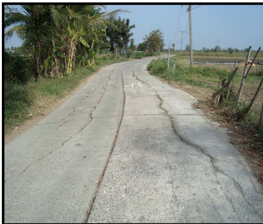
รูปที่ 4.5 ความเสียหายของถนน ค.ส.ล. บ้านวังหิน หมู่ที่ 5 (เส้นที่ 2)

ของแนวทางที่ 2 มีมูลค่าประมาณ 800,000 บาท ขณะที่ ราคาค่าก่อสร้างสำหรับแนวทางเลือกที่ 4 มีมูลค่าประมาณ 599,420 บาท จากเงื่อนไขทางเศรษฐศาสตร์ แนวทางที่ 4 จึงเป็นแนวทางที่เหมาะสมที่สุดสำหรับการแก้ไขปรับปรุงถนนเส้นนี้