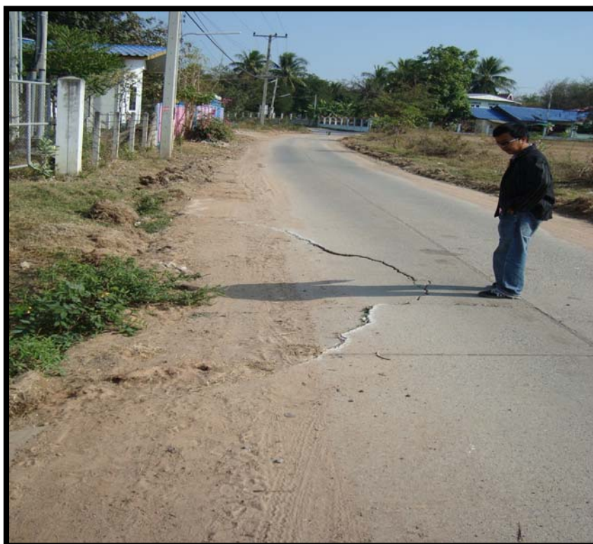
รูปที่ 4.3 ความเสียหายของถนน ค.ส.ล. บ้านมะค่าพัฒนา หมู่ที่ 10

วัสดุของชั้นทางผสมปูนขึ้นมาตามแนวรอยต่อหรือรอยแตกเมื่อน้ำหนักบรรทุกวิ่งผ่าน สาเหตุเกิดจากน้ำซึมผ่านลงไปตามรอยต่อหรือรอยแตกไปอยู่ใต้แผ่นพื้น เมื่อมีรถวิ่งผ่านพื้นมีการกระดกตัวขึ้นลงตรงบริเวณรอยต่อหรือรอยแตก เกิดแรงอัดทำให้น้ำพุ่งทะลักขึ้นมาบนผิวจราจร (รูปที่ 4.3) ดังนั้น แนวทางการแก้ไขที่เหมาะสมที่สุดคือแนวทางที่ 1 ตารางที่ ก.2 แสดงรายละเอียดการประมาณราคาค่าก่อสร้างด้วยแนวทางที่ 1 สำหรับถนนเส้นนี้ ราคาค่าก่อสร้างมีมูลค่าประมาณ 264,800.00 บาท