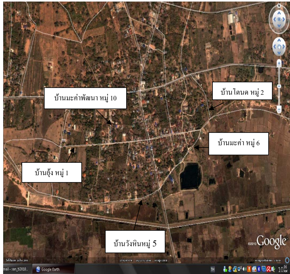
รูปที่ 3.2 แผนที่ตำบลบ้านโพธิ์