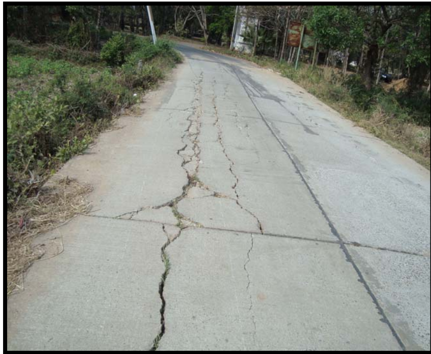
รูปที่ 4.6 ความเสียหายของถนน ค.ส.ล. บ้านวังหิน หมู่ที่ 5 (เส้นที่ 3)