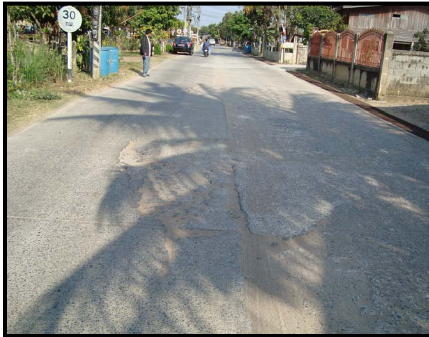
รูปที่ 4.8 ความเสียหายของถนน คสล. บ้านวังหิน หมู่ที่ 5 (เส้นที่ 5)