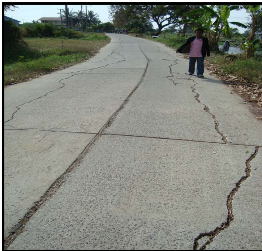
รูปที่ 4.7 ความเสียหายของถนน คสล. บ้านวังหิน หมู่ที่ 5 (เส้นที่ 4)