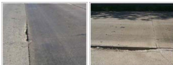
รูปที่ 2.2 ภาพแสดงโพรงขนาดใหญ่ที่รอยต่อระหว่างผิวถนนคอนกรีตกับไหล่ทางลาดยาง