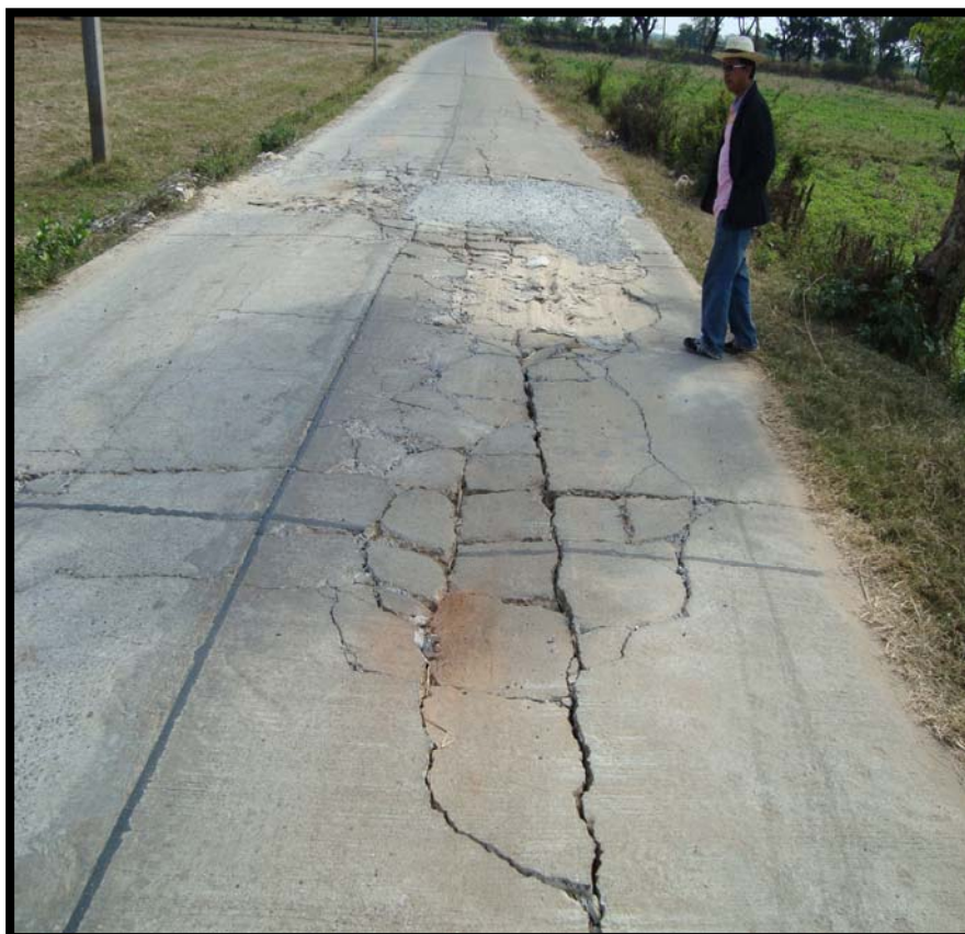
รูปที่ 4.4 ความเสียหายของถนน ค.ส.ล. บ้านวังหิน หมู่ที่ 5 (เส้นที่ 1)

จากการใช้เหล็กเสริมถ้าย่น้ำหนัก (รูปที่ 4.4) ดังนั้น แนวทางการแก้ไขที่เหมาะสมที่สุดคือแนวทางที่ 1 ตารางที่ ก.4 แสดงรายละเอียดการประมาณราคาค่าก่อสร้างด้วยแนวทางที่ 1 สำหรับถนนเส้นนี้ ราคาค่าก่อสร้างมีมูลค่าประมาณ 264,800.00 บาท