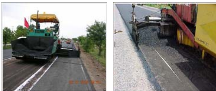
รูปที่ 2.10 การปูผิวจราจรใหม่