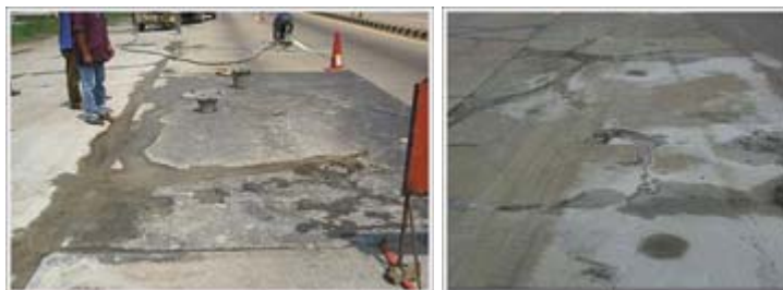
รูปที่ 2.6 การอัดน้ำปูนต่อไปจนเต็มโพรง