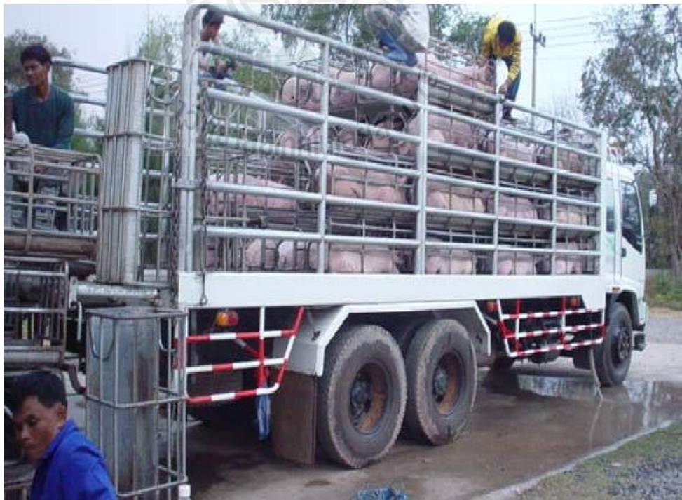
ภาพที่ 3.5 การบรรจุสุกรขึ้นรถบรรทุกแบบขังเดี่ยว

การขนส่งสุกรโดยวิธีนี้เป็นที่นิยมของผู้ขนส่งสุกรในระดับท้องถิ่นมากเนื่องจากสามารถขนส่งสุกรได้คราวละมากๆ และง่ายแก่การจัดการนำสุกรขึ้นและลงจากรถบรรทุก