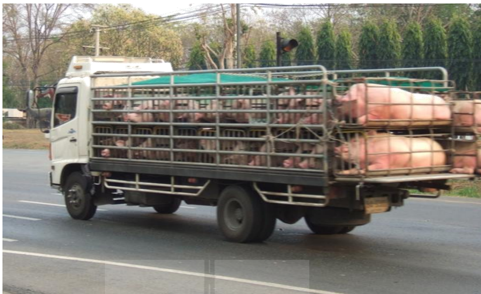
ภาพที่ 1.1 การบรรทุกสุกรแบบบรรจุในกรงเดี่ยว