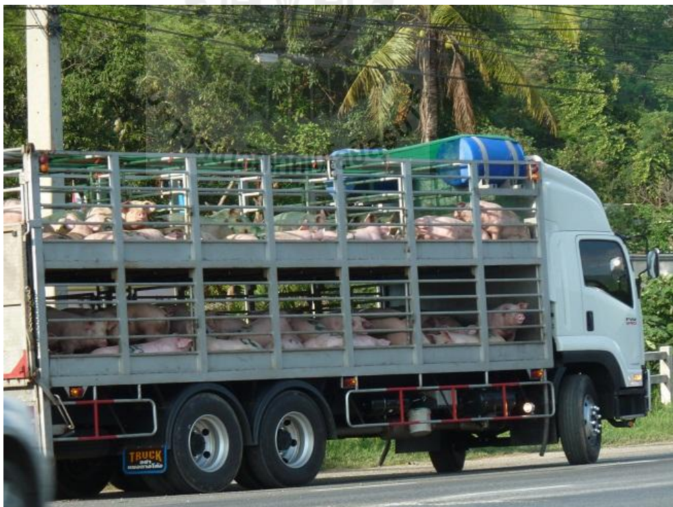
ภาพที่ 3.4 รถบรรทุกสุกรแบบขังรวมกลุ่มขณะเดินทาง