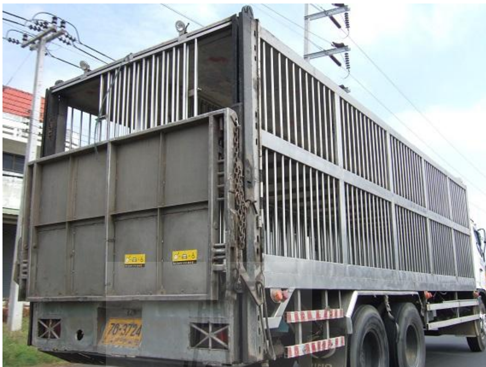
ภาพที่ 3.1 รถบรรทุกสุกรแบบขังรวมกลุ่มที่มีพื้นที่บรรทุกสองชั้น มีลิฟท์ยกสุกรขึ้น บรรทุกชั้นบนติดตั้งอยู่ที่ท้ายรถ