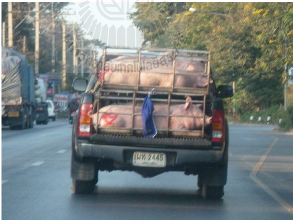
ภาพที่ 3.7 รถบรรทุกสุกรแบบขังเดี่ยวขนาดเล็กขณะเดินทาง