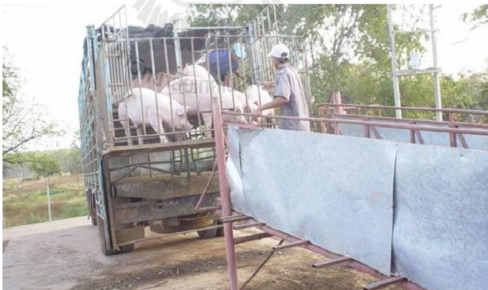
ภาพที่ 3.2 การยกสุกรขึ้นชั้นบนของรถบรรทุกแบบขังรวมกลุ่มโดยลิฟท์ที่ติดตั้งอยู่ที่ท้าย รถ