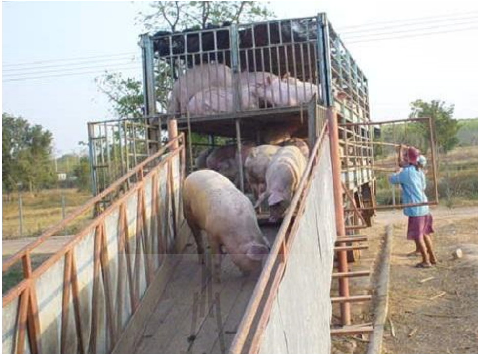
ภาพที่ 3.3 การบรรจุสุกรเข้าชั้นล่างของรถบรรทุกสุกรแบบขังรวมกลุ่ม