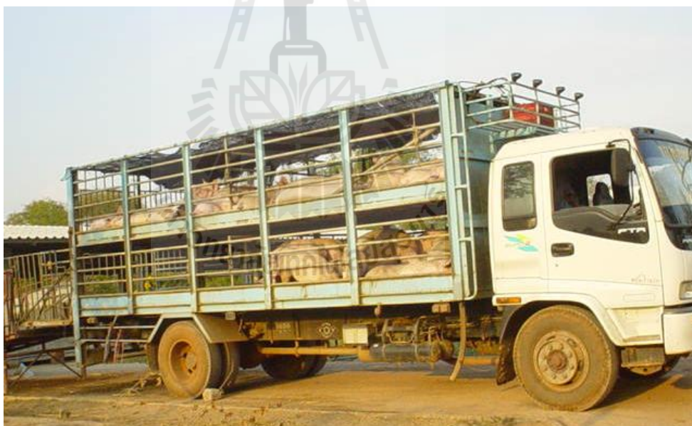
ภาพที่ 1.2 การบรรทุกสุกรแบบบรรจุในคอกชอย

2) ใช้รถยนต์บรรทุกขนาดใหญ่ที่ออกแบบเป็นพิเศษ โดยแบ่งส่วนบรรทุกออกเป็น 2 ชั้น แต่ละชั้นกันเป็นคอกจำนวน 4 – 6 คอก บรรจุสุกรในคอกเหล่านี้ประมาณคอกละ 10 ตัว (ภาพที่ 1.2) การขนส่งโดยวิธีนี้ยังไม่เป็นที่แพร่หลายเหมือนกับวิธีที่ 1 อาจจะเนื่องจากรถมี