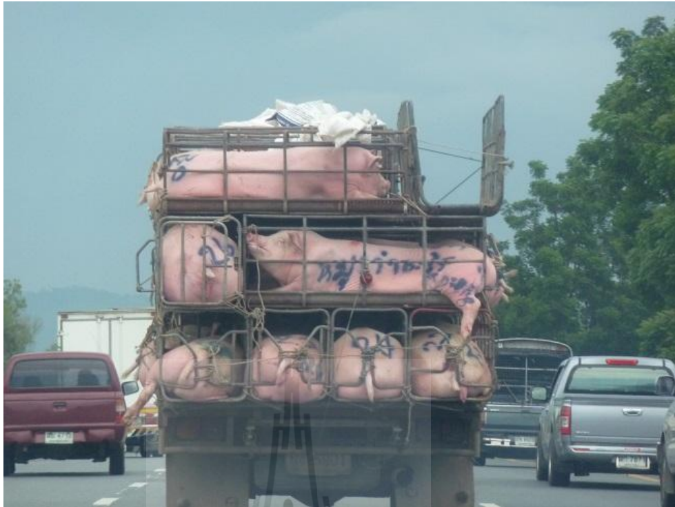
ภาพที่ 3.6 รถบรรทุกสุกรแบบขังเดี่ยวขนาดใหญ่ขณะเดินทาง