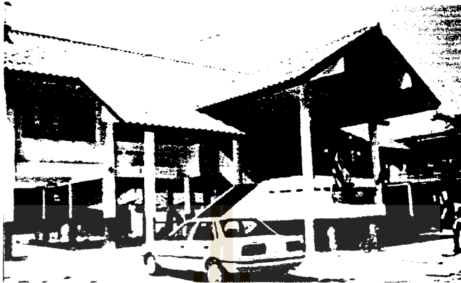
3. สถานีอนามัยทุ่งกระโดน