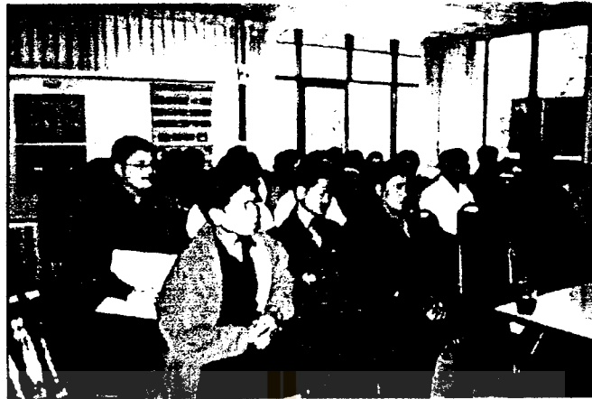
1. ประชาคมระดับตำบล