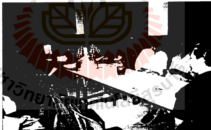
2. ประชาคมระดับหมู่บ้าน