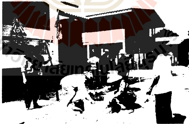
4. การร่วมมือร่วมใจในการพัฒนาท้องถิ่นของชาวบ้านทุ่งกระโดน