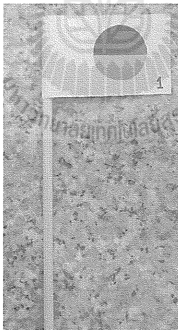
ภาพที่ 3 ตัวอย่าง การทำธง

1.5 ติดกล่องใส่ธงไว้ที่ชั้นหนังสือ จากนั้นนำธงใส่กล่องโดยจัดตามหมวดหมู่หนังสือ ดังภาพที่ 3